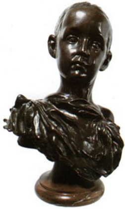
Paul Claudel à 13 ans