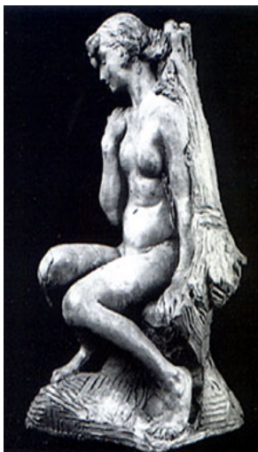
La Jeune Fille à la gerbe